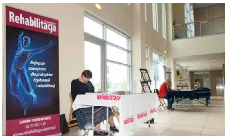
W holu CKD prezentowały się firmy i wydawnictwa związane z fizjoterapią