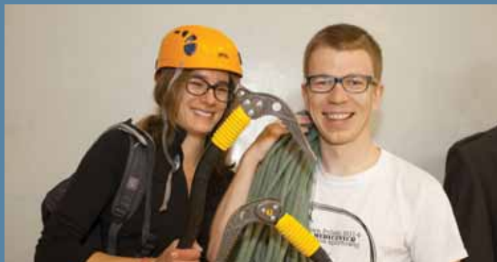
Przygotowani do wspinaczki