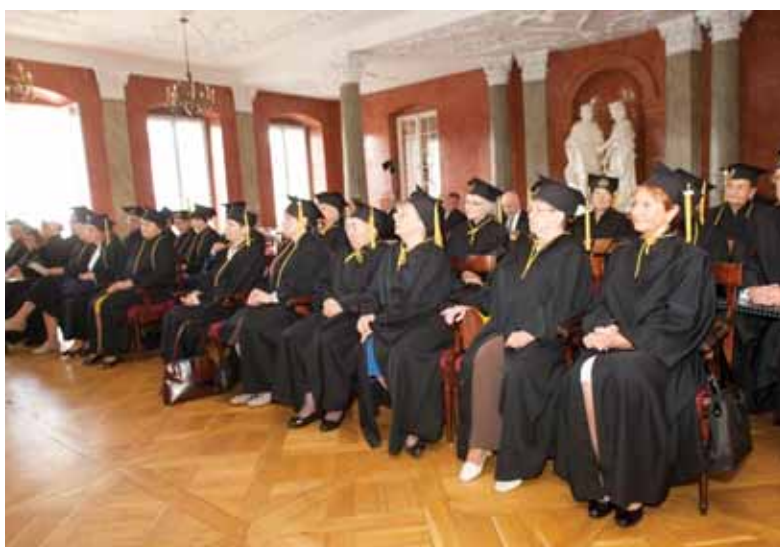
Absolwenci sprzed 50 lat