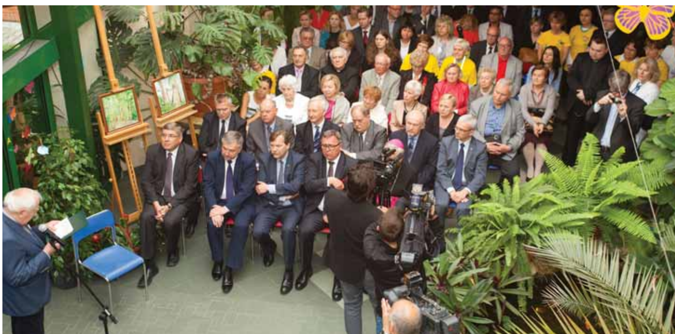
Na otwarciu przybyli goście, wolontariusze i rodziny chorych