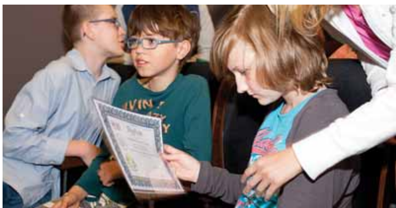
Dyplomy otrzymali wszyscy uczestnicy