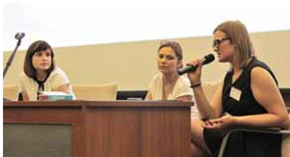
Dyskusja panelowa, sesja I zdrowie w gminie

Bardzo dużym zainteresowaniem cieszyła się sesja poświęcona edukacji seksualnej w szkole, której towarzyszyła ciekawa dyskusja o tym kto powinien być za tę edukację odpowiedzialny i w jakim zakresie i formie należy ją realizować.