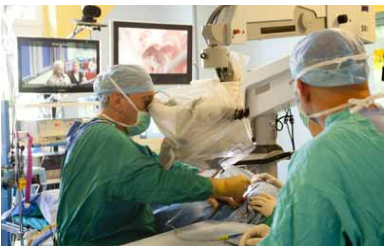
Bezpośredni przekaz z pola operacyjnego