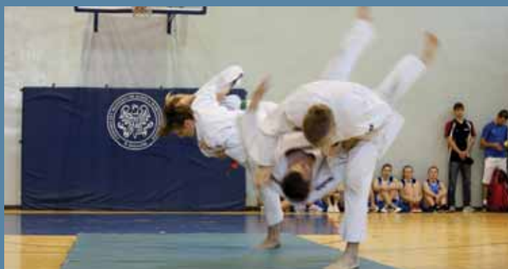
Zmagania w sztukach walki