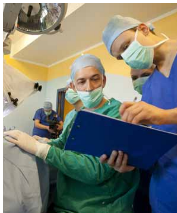
Część zespołu Kliniki podczas operacji

I tak w tym roku można było obserwować operacje m. in. z Rio de Janeiro, Toronto, Barcelony, Madrytu, Londynu, Hannoveru, Frankfurtu, Antwerpii, Montpellier, Poznania, Dubaju, Istambułu i Sydney.