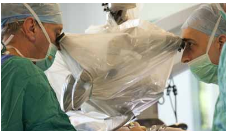
Operacje chirurgii usznej wymagają niezwyklej precyzji

Klinika poznańska przeprowadziła dwie operacje. Pierwsza to chirurgiczne leczenie otosklerozy, której celem jest wymiana patologicznie zmienionego strzemiączka na specjalną protezę oraz operację założenia tzw. implantu hybrydowego u 10-letniej dziewczynki z zachowanymi jedynie częstotliwościami niskimi. Celem tej drugiej operacji było utrzymanie istniejących żywych komórek słuchowych i odtworzenie poprzez implant brakujących częstotliwości średnich i wysokich. Obie operacje zakończyły się dobrym wynikiem. Inne zespoły pokazały takie operacje jak: perlak ucha środkowego, nerwiak nerwu słuchowego, założenie implantu ślimakowego, odtworzenie błony bębenkowej i przecięcie nerwu przedślonkowego.