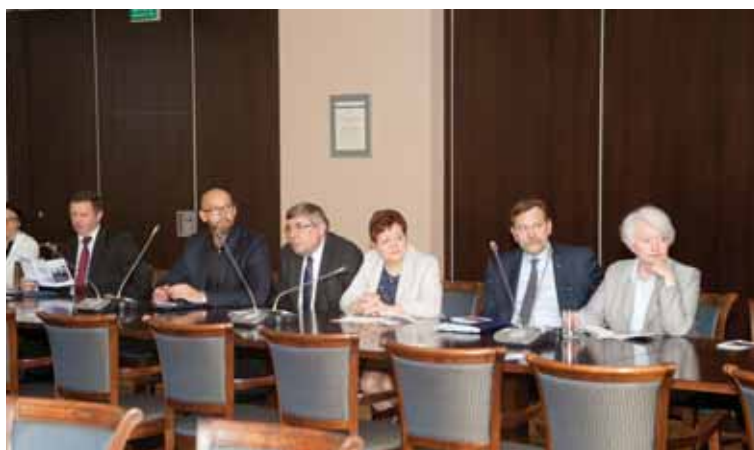
Posłowie i samorządowcy wielkopolscy