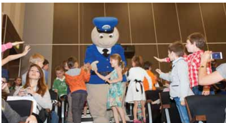
Dzieci z radością powitały Pyrka – policyjną maskotkę