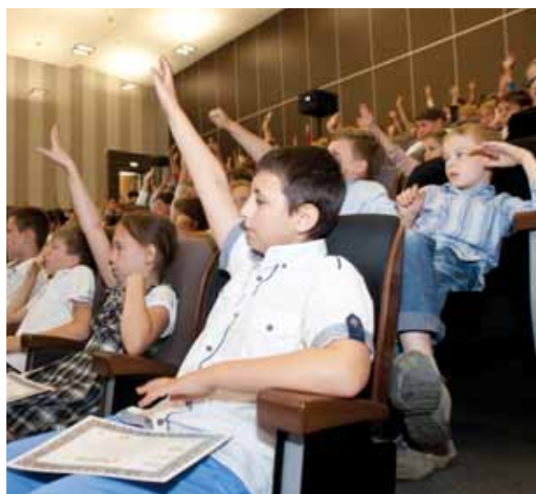
Na pytania o bezpieczne zachowania większość znała odpowiedzi