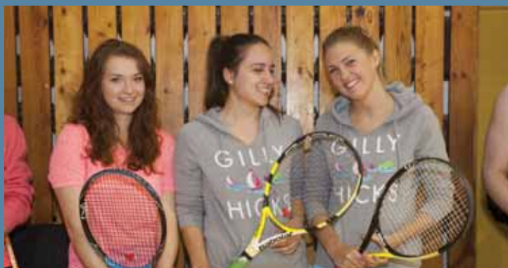
Tenisistki przed występem na korcie